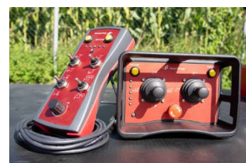
Telecomando de serie Radio comando en opción

Conformité CE - Conforme aux normes IP 65 et EN 13155