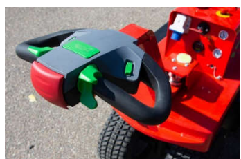
Timón y palancas de mando ergonómicas