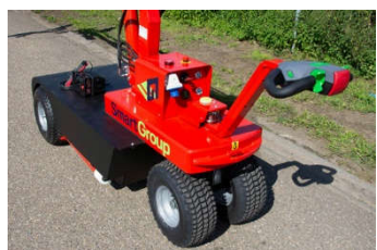
Chasis con estabilizadores y ruedas todoterreno